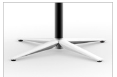
Tubo de acero negro Base de 4 pies Pulida - Ø 67,5 cm Soleta antideslizante