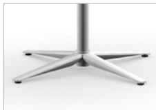
Tubo de acero Aluminizado Base de 4 pies Aluminizada - Ø 67,5 cm Soleta antideslizante