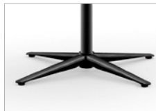
Tubo de acero negro Base de 4 pies Negra - Ø 67,5 cm Soleta antideslizante