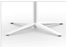
Tubo de acero Blanco Base de 4 pies Blanca - Ø 67,5 cm Soleta antideslizante