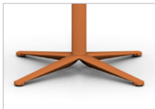
Tubo de acero Naranja Base de 4 pies Naranja - Ø 67,5 cm Soleta antideslizante